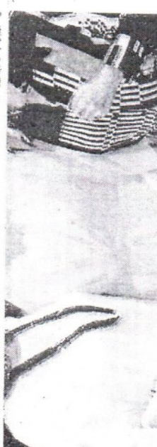
Terá lugar em Fortaleza, dias 8 e 9 de outubro, no Seara Praia Hotel, o CONNIM - Congresso Norte-Nordeste de Imagiologia. Apesar da palavra dar margem a várias interpretações, Imagiologia é o estudo dos órgãos e sistemas do corpo humano, através das diversas modalidades de exames de imagem. Reforçar o trabalho desenvolvido pelas forças de segurança do estado, seja em busca e salvamento, investigação ou de forma ostensiva. É com esse objetivo que o Governo do Ceará entregou 69 viaturas para o Corpo de Bombeiros Militar do Estado do Ceará, Polícia Civil do Estado do Ceará e Polícia Militar do Ceará. A governadora Izolda Cela e o titular da Secretaria de Segurança e Defesa Social (SSDPS), Sandro Caron, estiveram presentes ao evento.