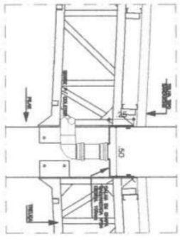
01.04 DET: CALHA METÁLICA ESCALA 1/25